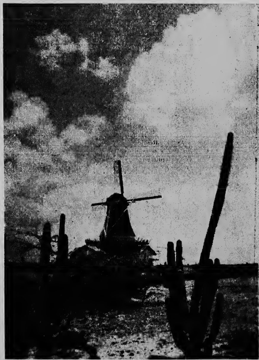
E bishitante ta hanja enteramente un otro bista ora cu e bai mira e mulina parti p'atras. E bista cu e ta hanja mira aqui tras, ta completamente „arubano“! „E lago lombrante“ a traha luga aya pa cactus y sumpinjanan di kwihii.